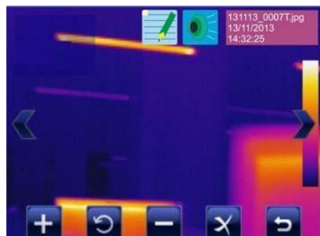
Vokální a textové anotace