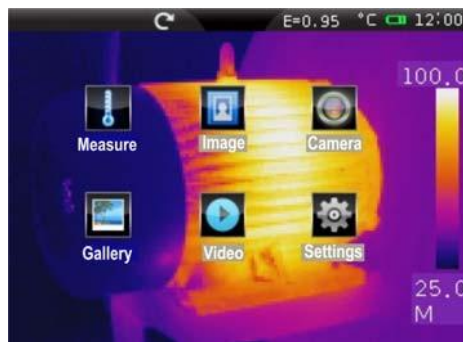
Obecné menu s ikonami

Model THT60 je moderní infračervená kamera s kapacitní barevnou dotykovou obrazovkou TFT pro rychlé a intuitivní ovládání