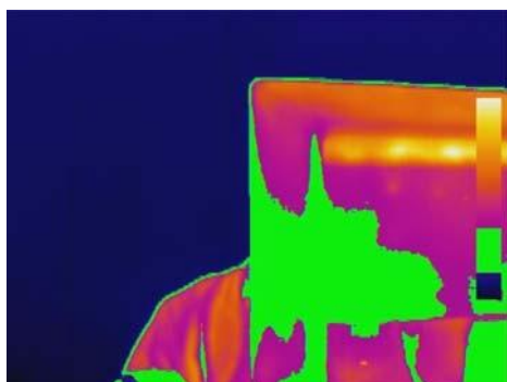
Pokročilá analýza: funkce isotherm