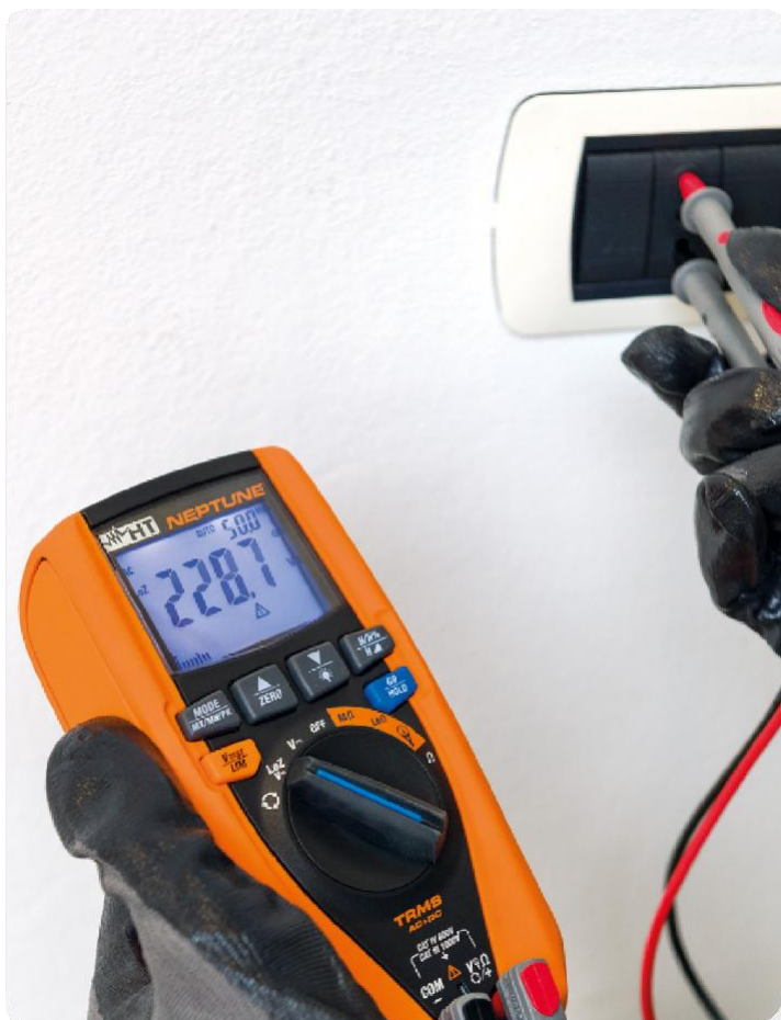
Nulování bludného napětí.