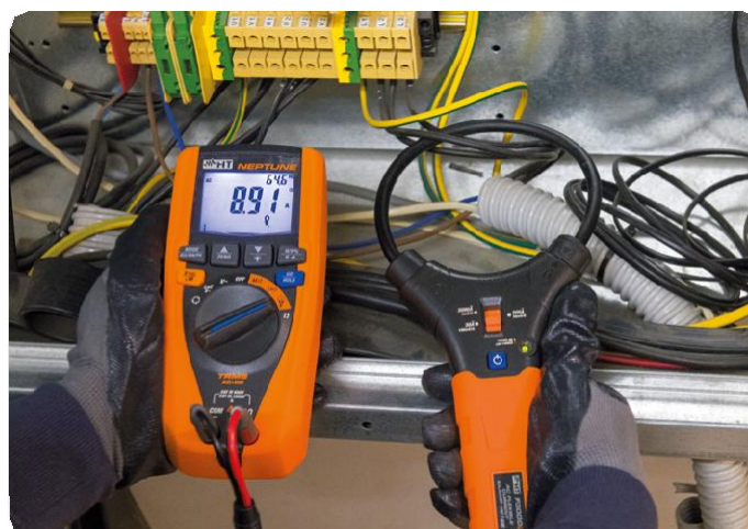
Měření proudu pomocí flexibilního převodníku F3000U.