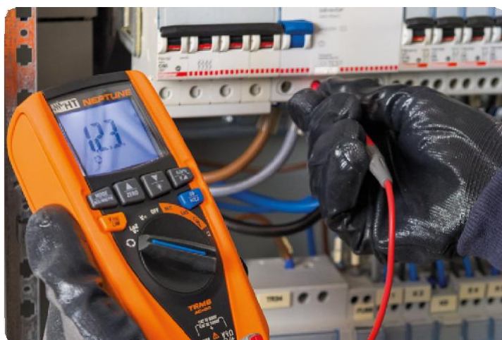
Měření sledu fází jedním vodičem.