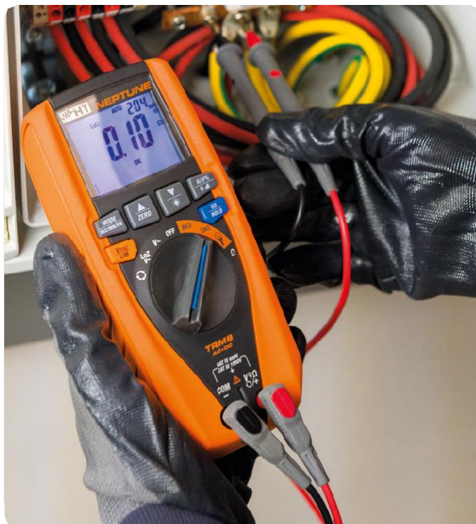
Kontinuita ochranných vodičů s 200mA.