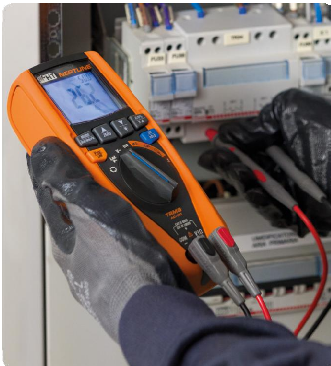
Měření napětí pomocí testovacího vedení test.