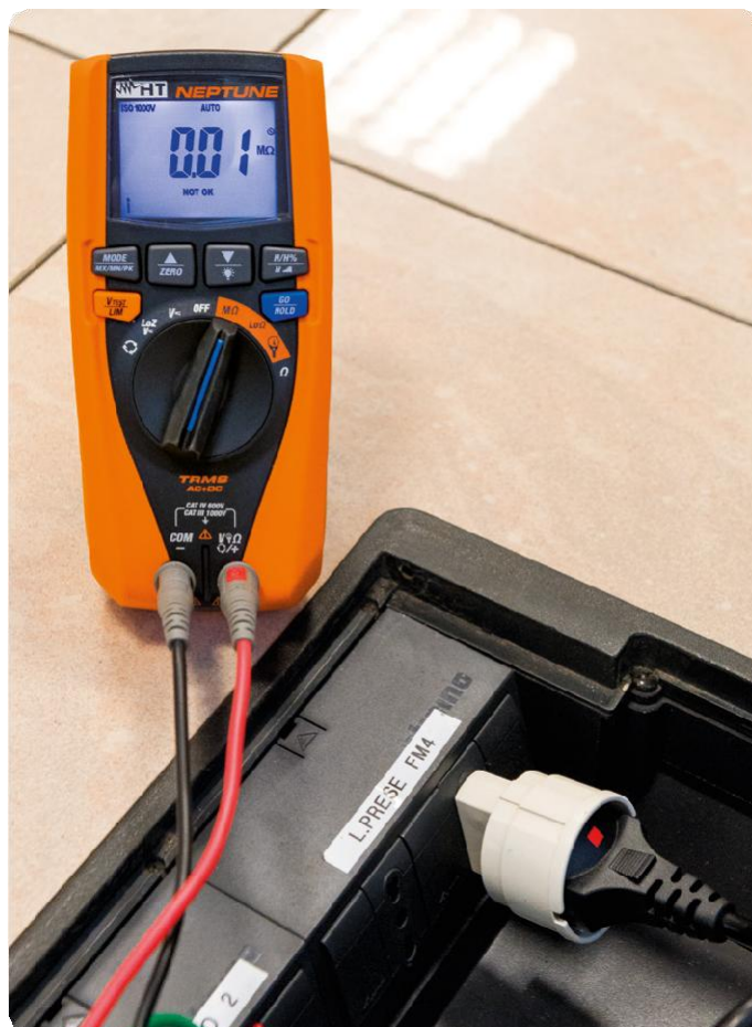
Měření izolačního odporu (volitelný adaptér Schuko C2065).