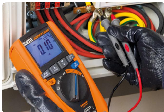
Kontinuita ochranných vodičů.